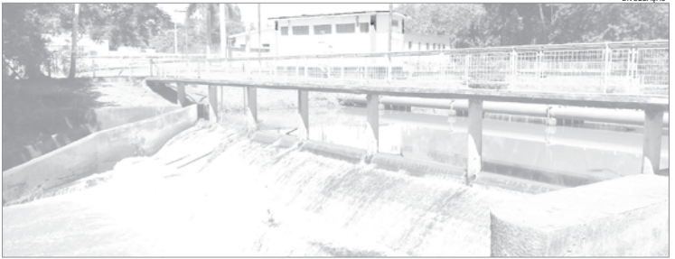
ABASTECER - Ribeirão Bagaçu é responsável por 50% da água que abastece Araçatuba, enquanto o Rio Tietê responde por 40% e os poços por 10%

O abastecimento de Araçatuba é feito com 50% de água vinda do Ribeirão Bagaçu, 40% do Rio Tietê e 10% de poços artesianos.