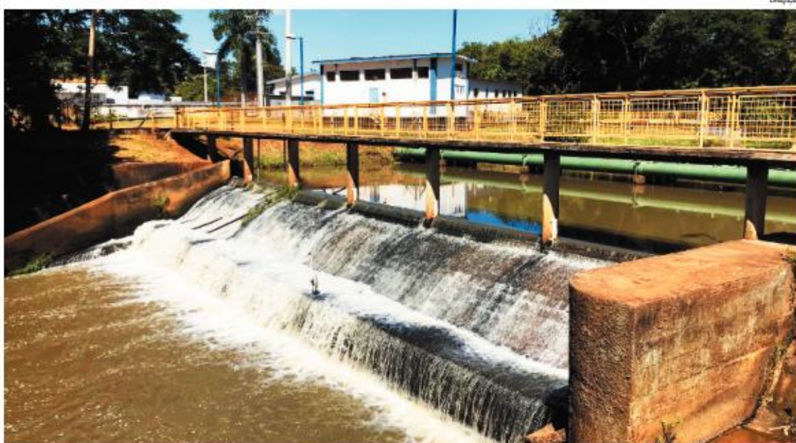
ESTÁVEL Desde o início do ano, a produção de água se mantém estável em Araçatuba, variando entre 2,1 milhões de m 3 e 1,9 milhões de m 3

De janeiro a maio deste ano choveu 598,2 milímetros, contra 366,5 mm no mesmo período do ano passado. No início de junho,